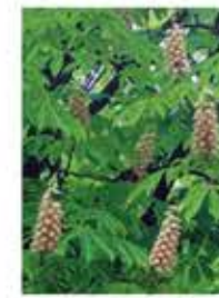
トチノキ Aesculus turbinata Blume トチノキ科

サンクン広場に木陰を作るトチノキ。春先に白い円錐形の花序をつけ、秋には丸い実を落とす。中にあるつややかな栗色の種子はクリに似ているが、苦味物質のサポニンやタンニンが多くそのままでは食べられない。あく抜きをしてトチ餅などに加工する。縄文時代の遺跡からたくさん殻が出土する。当時の主食だったのだろう。