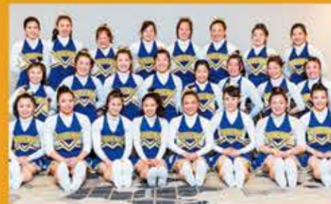
1995年創部。月曜日を除く平日は3時間、それ以外19:00から18:00まで練習。地域から海外イベントまで、積極的に活動を行う。