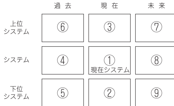
図5 9画面法の枠組み